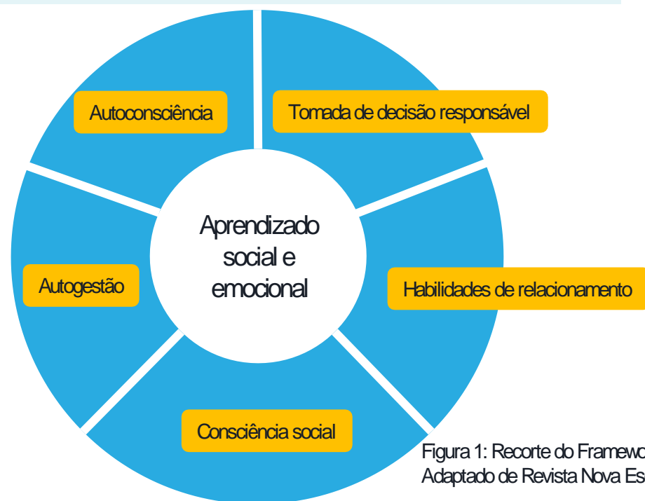
Figura 1: Recorte do Framework Casel Adaptado de Revista Nova Escola.

Diante dos novos paradigmas e demandas do séc. XXI, a escola tem o desafio de promover o desenvolvimento integral dos estudantes, tornando-os capazes de lidar com um mundo cada vez mais complexo e conflituoso. Segundo a BNCC, para atingir esse objetivo, ela deve incorporar as tecnologias às práticas de ensino-aprendizagem, além de incluir o ensino de habilidades socioemocionais nos currículos. O estudo realizado apresenta reflexões sobre como ferramentas de comunicação síncrona por texto, como o WhatsApp podem ser utilizadas no ensino destas habilidades.